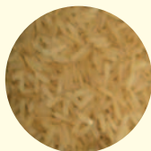
ข้าวกล้อง O-Rice