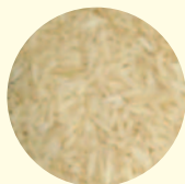
ข้าวกล้องทั่วไป Brown Rice